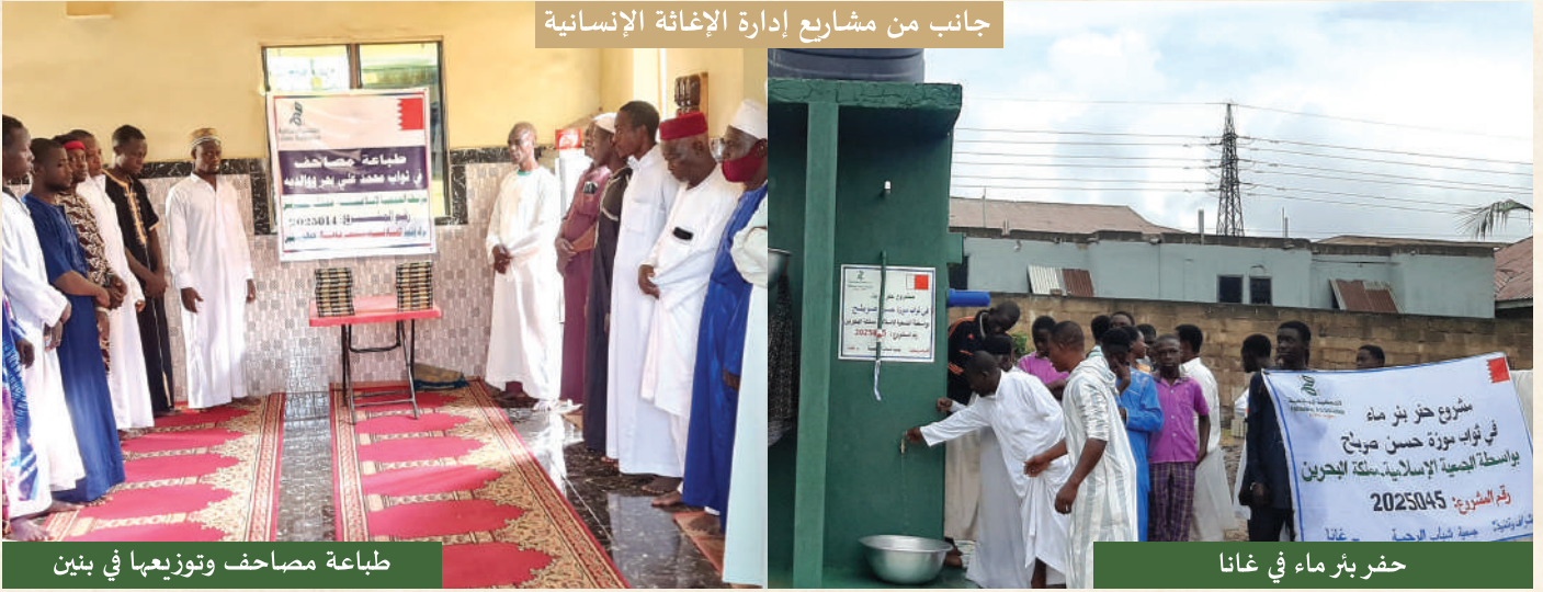
طباعة مصاحف وتوزيعها في بنين