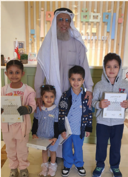
تقديم الهدايا لروضة الفوز