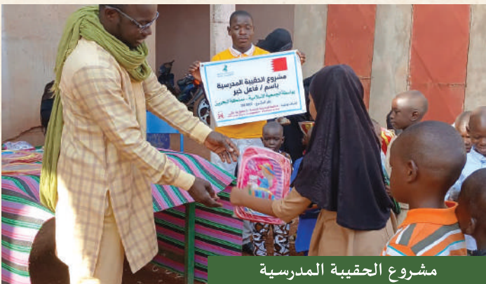
مشروع الحقيرة المدرسية