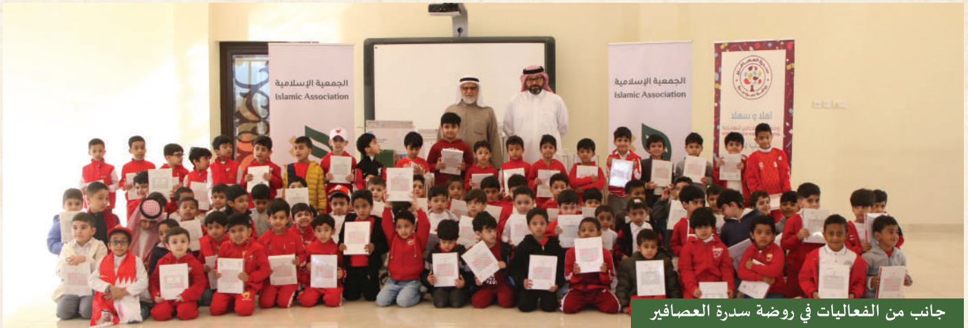
جانب من الفعاليات في روضة سدره العصافير

وقد لقيت المبادرة ترحيباً واسعاً من إدارات رياض الأطفال وأولياء الأمور، الذين ثمنوا هذه اللفتة الكريمة من الجمعية الإسلامية، معتبرين إياها نموذجاً يُحتذى به في تعزيز الشراكة المجتمعية بين مؤسسات المجتمع المدني والقطاع التربوي.