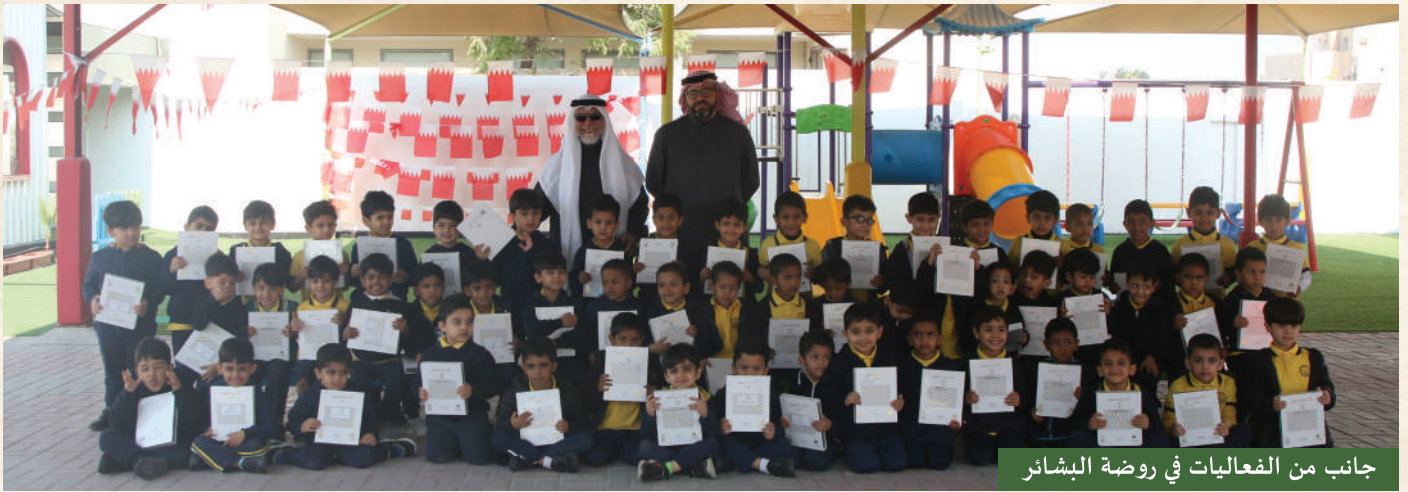
جانب من الفعاليات في روضة البشائر