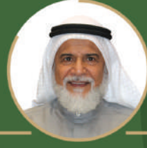
الشيخ د.عبد اللطيف محمود آل محمود رئيس مجلس الإدارة